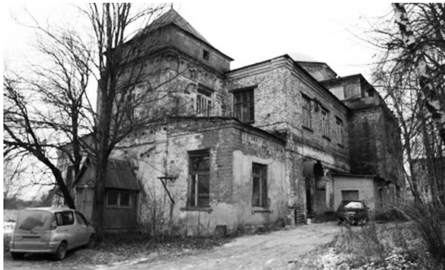
Новый Спас в Новом Быту