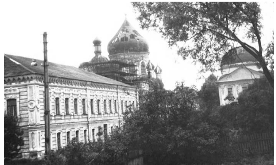
Техникум в Новом Быту. 1948 год