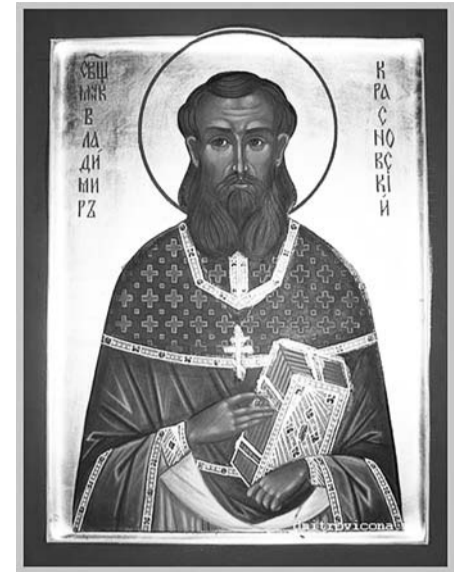
Икона священномученика Владимира Красновского