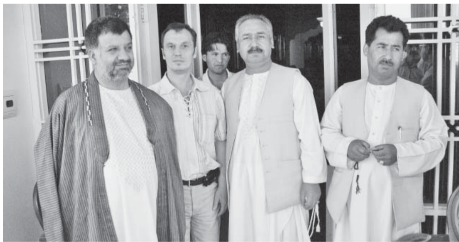
У порога резиденции мэра Мазари-Шарифа

В Термез прилетели рано утром. Таможня узбекская очень суровая и долгая, но мы не спешили и встали в очередь последними. Таможенники через некоторое время сами нас позвали вне очереди и весьма любезно поспособствовали в оформлении документов. Наняли такси до знаменитого Термезского моста. Вновь таможня, вновь бумаги. С каждого, кто пересекает границу, взимают денежный сбор, но с русских узбекский таможенник деньги не взял, сказал: мы вас уважаем! Мне вспомнилось сразу как у нас гнобят несчастных гастарбайтеров и стало стыдно за свой народ.