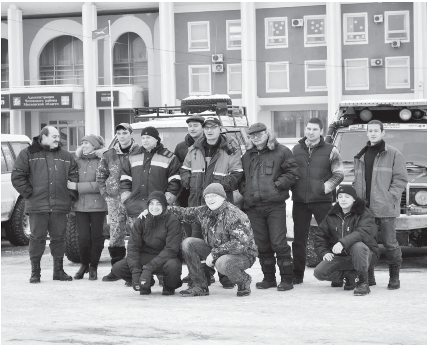
Регламент соревнований читайте на 12-й стр.