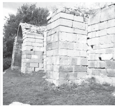
Остался фрагмент стены.

Вокруг Троицкого собора стоят одноэтажные частные дома, бродят лошади. Так было и в древние времена, когда в деревянных, тесно прижавшихся друг к другу кремлевских домах жили так называемые «дворники», содержавшие в порядке полупустые в мирные дни строения.