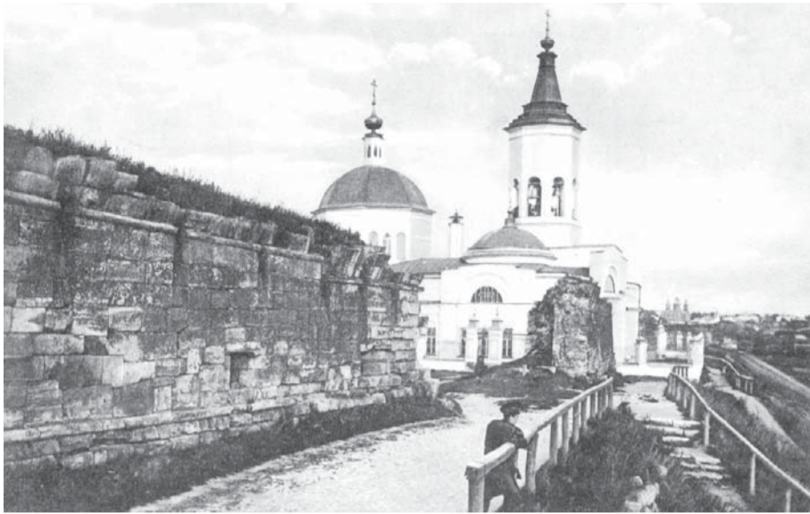
Так было. Начало XX века.