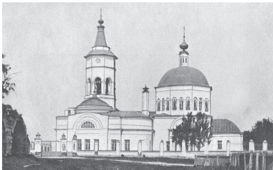
Троицкий собор. XIX век.

Вспоминая о находках А.В. Павлихина, мы вновь мысленно возвращаемся к древнерусскому городу Неренску,