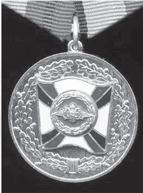
Медаль "За трудовую доблесть" с удостоверением.

Добавить Медаль "За трудовую доблесть" Лот: 017/МО в корзину