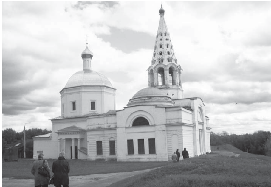
Троицкий собор после последней реставрации

Картина мастера исторической живописи Аполлинария Васнецова помогает нам представить себе, каков был серпуховской кремль. Стены — мощные, светлые — не серые, а теплого оттенка, скорее желтоватые. Единственные