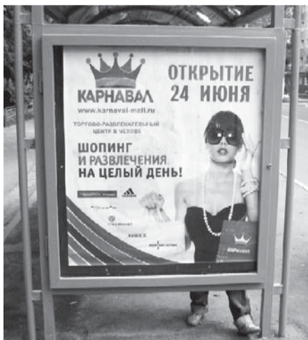
Найдите 10 отличий!

Известно, что еще полгода назад наша обожаемая мэрия попыталась «наехать» на предпринимателей, разукрасивших