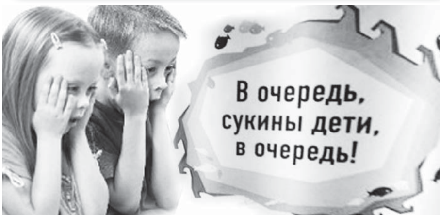
М.Булгаков, из романа «Мастер и Маргарита».

Весна в самом разгаре, а потому помимо насморка обостряется и еще одна родительская проблема: устройство любимого дитяти в сад. Если хотите устроить ребенка в дошкольное образовательное учреждение в Чехове или районе, то первое, что вам нужно сделать — это родить его. Родили и даже получили свидетельство о рождении? Отлично! Не теряйте времени — бегите со всех ног в управление образования и ставьте своего новорожденного человека в очередь на место в детском саду. Постоит годик-другой, глядишь, и повезет — пойдет в сад. Не повезет — все равно пойдет... к школе. До пяти лет взять ребенка в сад не просто могут, но обязаны. И этому есть простое объяснение — очередь все равно рано или поздно рассосется, да и когда-то же надо начинать подготовку к школе! Тут вопрос, кстати, тоже интересный... Нынче детей в школу ведут уже ученые: читать, писать и считать надо научить до первого класса, если хочется, чтобы ребенок попал в хороший класс с нужным уклоном. Условия кастинга надо соблюдать, что поделаться?! Но это другая тема для другого разговора, к которому мы вернемся в следующий раз.