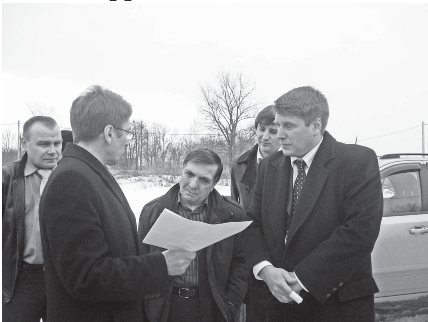
Поброности читайте на стр.3