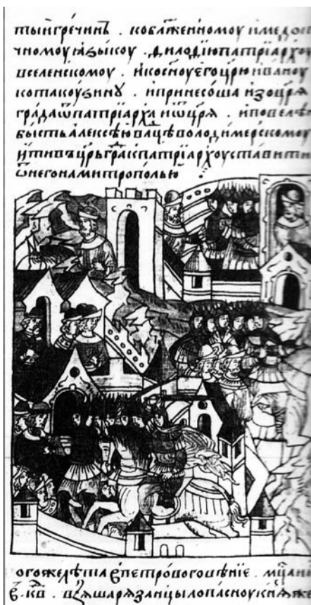
Взятие рязанцами Лопасни. Миниатюра Лицевого летописного свода. XVI век