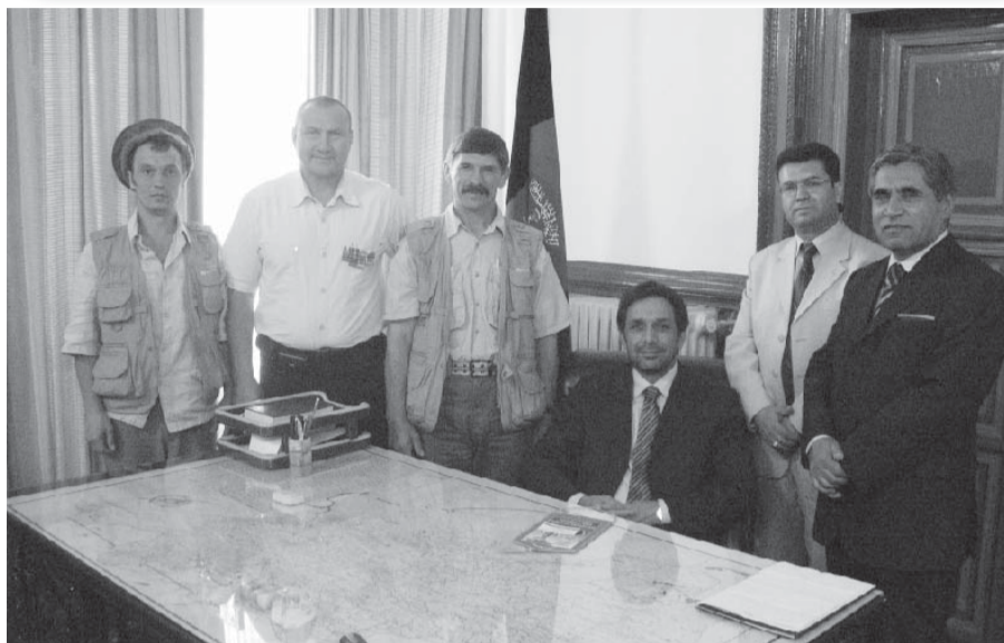
С вице-президентом Афганистана

В один из дней едем встречаться с руководством Афганистана. Прежде чем попасть в дом правительства нас очень тщательно и долго шмонают, даже в носки заглядывают. Затем проводят в апартаменты первого вице-президента Афганистана Ахмада Зия Массуда. Пока ожидаем второго человека страны, пьем чай и по очереди фотографируемся в кресле хозяина на фоне государственного флага. С тех пор меня не покидает желание посидеть в Путинском кресле, но пока что-то никак не срывается. Кабинет обставлен по-восточному шикарно и броско, но всюду чувствуется отменный вкус. Хозяин радушен и гостеприимен, нам оказываются знаки особого уважения.