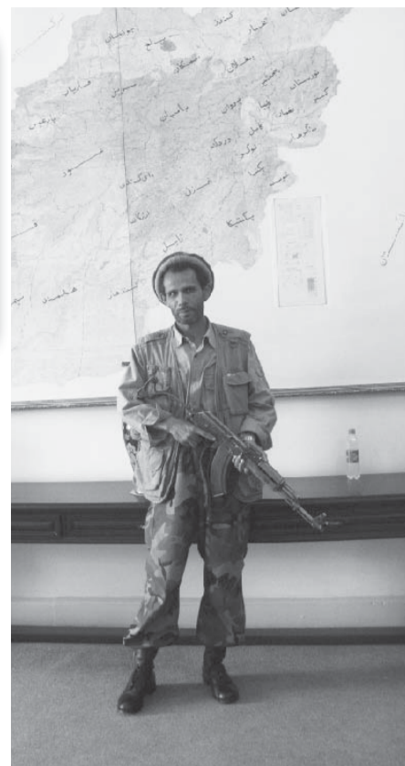
Беспечный охранник, отдавший нам автомат

Уже по возвращении домой, я понял, что афганцы относятся к нам гораздо лучше, чем мы сами к себе. Двадцать лет назад, вернувшись молодыми с войны, казалось, что нам открыты все дороги, и нам все по плечу. Что мы сумеем пригодиться своей стране. На деле все вышло совсем по-другому. Как не нужны мы были никому 20 лет назад, так не нужны и сейчас. Затеплилась