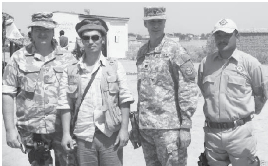
Офицеры НАТО возле дворца Амина

На следующий день мы поехали смотреть дворец Амина. Сложность заключалась в том, что он расположен на территории НАТОвской базы. Подъехали к КПП, представились, сказали что руководство страны дало добро на посещение. Пока ждали начальство, пообщались с младшими офицерами.